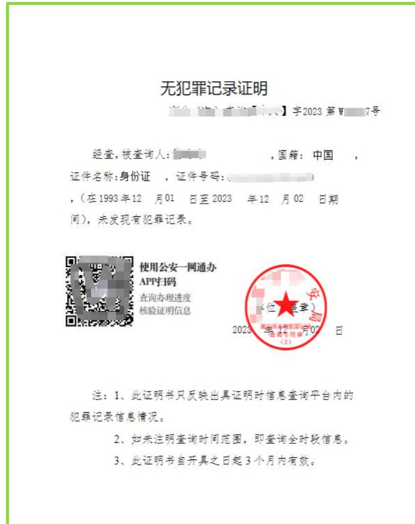
张三无犯罪记录证明

第2步： 上传无犯罪记录证明原件扫描件(.pdf格式)，命名为“张三无犯罪记录证明”。须为有效期内公安机关出具；须上传原件扫描件（该材料为执行教师准入查询制度使用），如图：