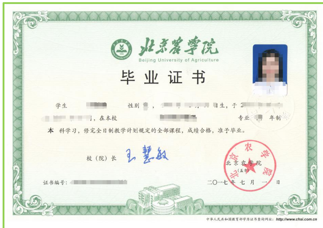
PDF 文档第 1 页，本科毕业证

第4步： 上传学历学位证原件扫描件（.PDF 格式），命名为“张三学历学位证”。须上传 全学段 学历学位证扫描件，即本科至博士阶段，如 未取得博士学历学位 须上传教育部学籍在线验证报告；每一个证书 独立扫描 后合并为一个 PDF 文档上传（该材料为办理入编及岗位聘用以及入档手续使用），如图：