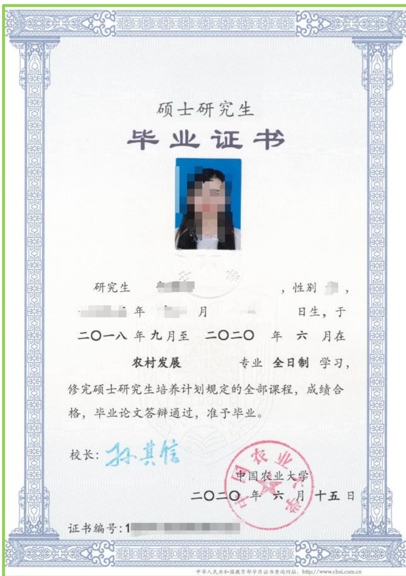
PDF 文档第 3 页，硕士研究生毕业证