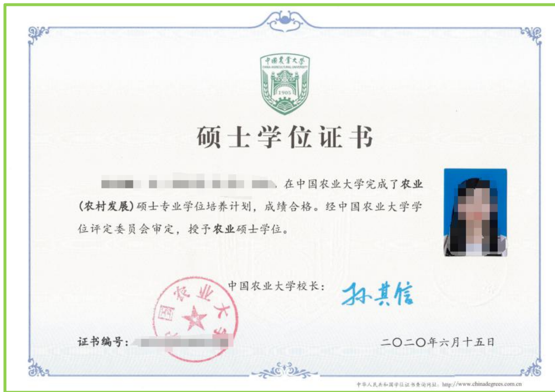
PDF 文档第 4 页，硕士研究生学位证