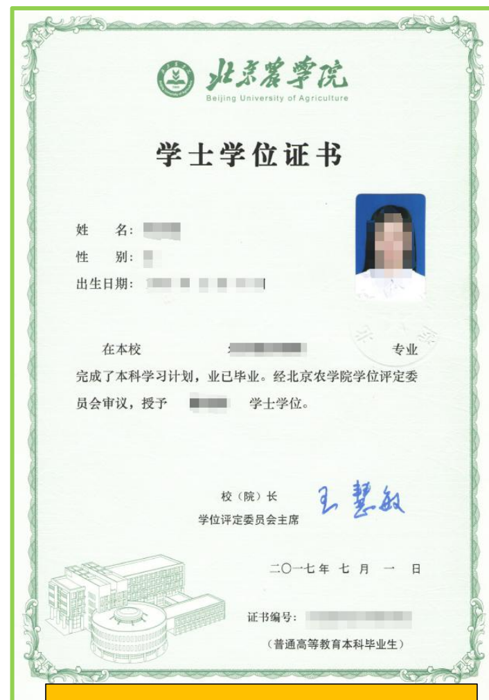
PDF 文档第 2 页，本科学位证